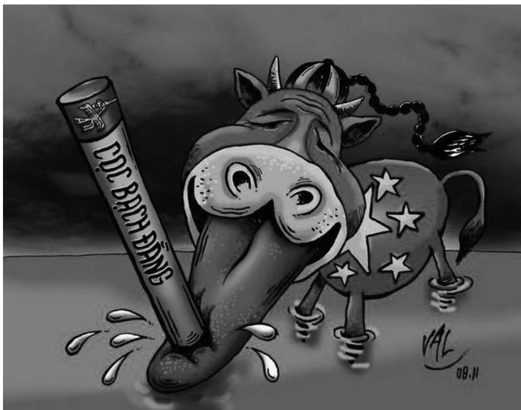
Рис. 2. Карикатура из сети Интернет [15]. Надпись — «Батьдангский кол»

яла в том, чтобы во время отлива вбить в дно реки заостренные сверху деревянные колья такой высоты, чтобы во время прилива их было не видно. Когда китайский флот появился в заливе Халонг, вьетнамцы вступили в бой, а затем с началом прилива по приказу своего главнокомандующего начали отступление, заманивая противника в устье реки Батьданг. Как только начался отлив, вьетнамский флот с подкреплениями перешел к широкомасштабному наступлению, тесня противника к месту заранее подготовленной засады. Тяжелые китайские корабли на скорости налетали на вбитые колья, получали пробоины и тонули. Более половины судов