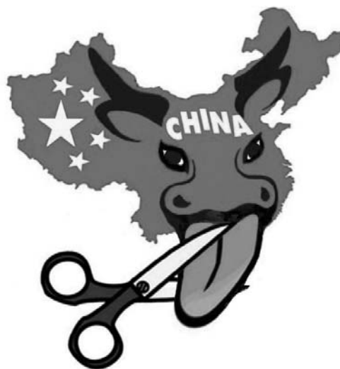
Рис. 3. Карикатура из сети Интернет, призывающая отрезать «бычий язык» в Южно-Китайском море [13]

Все это можно расценивать как проявление определенной информационной политики, направленной на торпедирование «китайского проекта» в регионе. Очевидно, что такая пропаганда не способствует повышению международного авторитета Китая в ЮВА, а также консолидации сил перед очередным раундом надвигающегося передела сфер влияния в регионе. Очевидно,