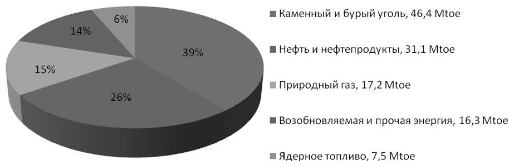
Диаграмма 2. Планируемый энергетический баланс Польши на 2030 г.

Ист. данных: Prognoza na zapotrzebowanie na paliwa i energię do 2030 roku. Załącznik 2 do „Polityki energetycznej Polski do 2030 roku”. Rada Ministrów. Warszawa, 10 listopada 2009 r. S. 14.