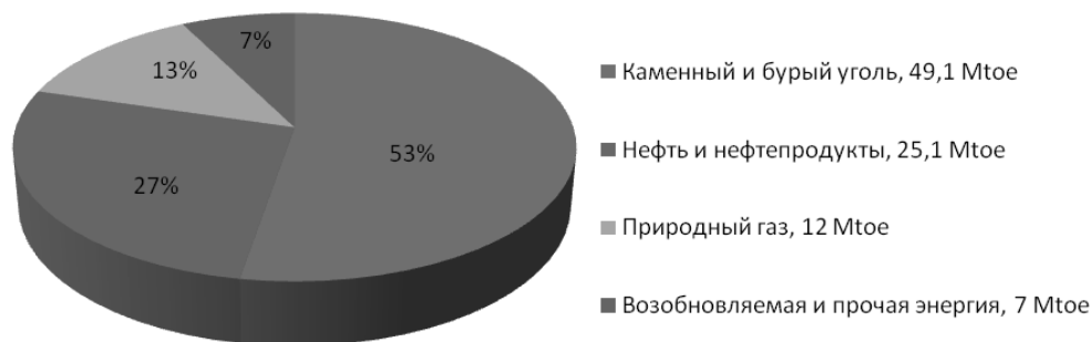
Диаграмма 1. Фактический энергетический баланс Польши на 2010 г.

тельность. В рамках данной статьи мы рассмотрим экономические, политические и правовые предпосылки стратегии Варшавы в энергетическом сотрудничестве с Москвой, затем с помощью метода ситуационного анализа обозначим основные противоречия между идеальной и реальной моделями взаимодействия и попытаемся представить основные факторы, влияющие на формулирование и реализацию внешней энергетической политики. В данном исследовании мы намеренно ограничимся рассмотрением только нефтегазового аспекта энергетического взаимодействия, который является наиболее показательным во взаимоотношениях государств на международном энергетическом рынке.