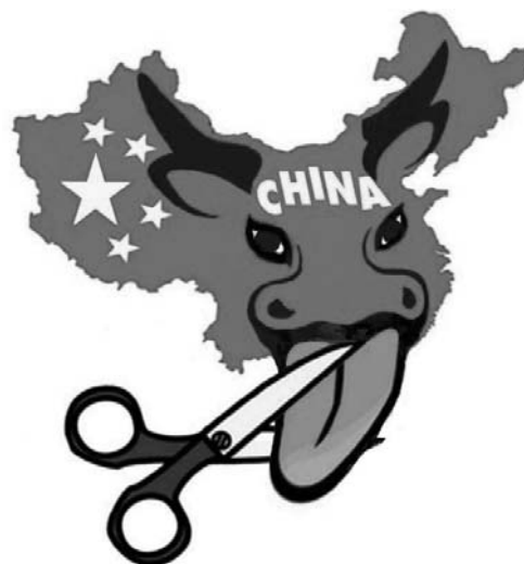
Рис. 3. Карикатура из сети Интернет, призывающая отрезать «бычий язык» в Южно-Китайском море [13]

Все это можно расценивать как проявление определенной информационной политики, направленной на торпедирование «китайского проекта» в регионе. Очевидно, что такая пропаганда не способствует повышению международного авторитета Китая в ЮВА, а также консолидации сил перед очередным раундом надвигающегося передела сфер влияния в регионе. Очевидно,