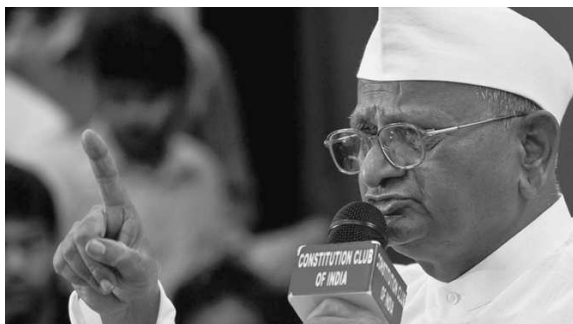
Анна Хазаре, индийский общественный деятель, активист антикоррупционного движения в Индии.

имевшие связи в правительстве, незаконно сумели получить право на разработку еще неосвоенных месторождений угля 27 .