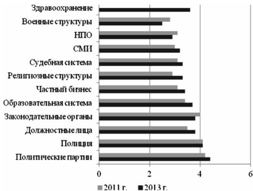
Диаграмма 1. Степень коррумпированности различных институтов в Индии, 2011 и 2013 гг.

62% опрошенных заявили, что платили взятку при контакте с полицией, 61% - с органами, отвечающими за регистрацию и выдачу разрешений, 48% - в отношении образовательных учреждений, 36% - судебных органов. По индексу восприятия коррупции ( Corruption Perceptions Index, CPI ) за 2014 г. Индия находится на 85-м