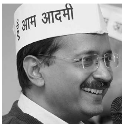
Арвинд Кеджривал, индийский политик, лидер Аам адами парти, с декабря 2013 г. - главный министр Дели.

партии БДП. Лидер ААП стал главным министром столицы 38 .