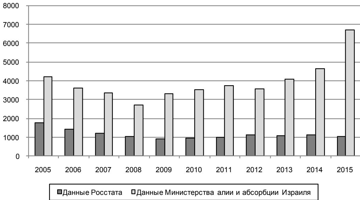
Рис. 1. Сравнение статистических данных Росстата и Министерства алии и абсорбции Израиля о количестве эмигрировавших в Израиль (человек)

2014 г. количество прибывших в Чехию россияне увеличилось в 2,7 раза, с 2146 человек до 5862. По данным российской статистики за этот же период количество выехавших в Чехию выросло