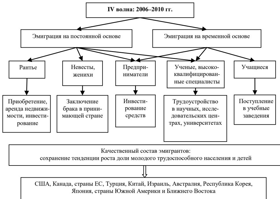
Рис. 4. Четвертая волна эмиграции из современной России

IV волна. На вторую половину 2000-х гг. (2006–2010 гг.) пришелся очередной экономический кризис. Всплеск безработицы и сокращение емкости внутреннего рынка товаров и услуг выталкивают российских предпринимателей за рубеж в поисках приложения своих капиталов и развития бизнеса. По мнению многих экспертов, в этот период они составили самую многочисленную группу эмигрантов. Остальные каналы отъезда и натурализации эмигрантов из России также продолжали активно работать, в том числе выезд на учебу, поиск рабочих мест для получивших образование (рис. 4).