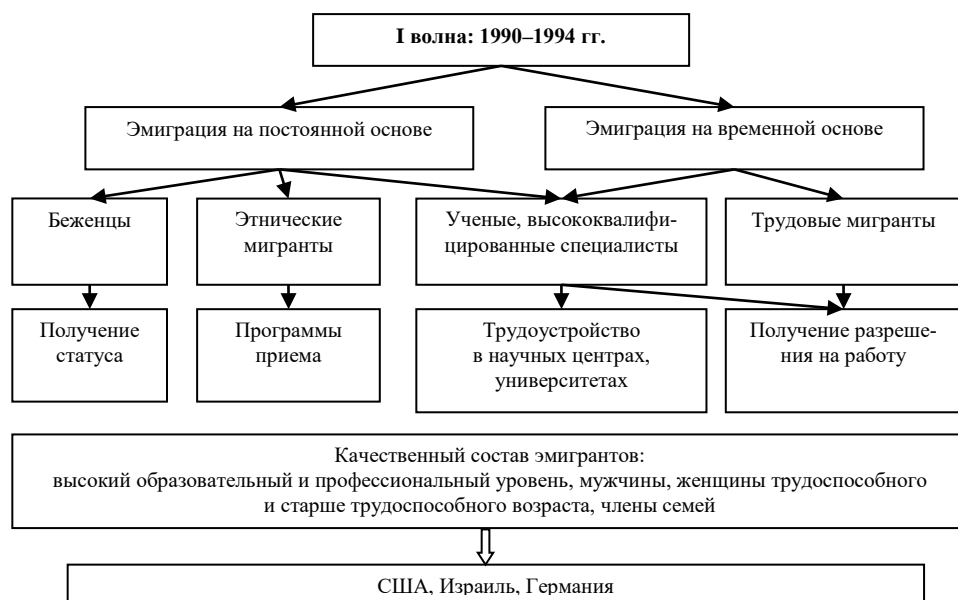
Рис. 1. Первая волна эмиграции из современной России

Основные страны приема эмигрантов из России – Германия, Израиль и США. Так, в 1993 г. на эти три страны пришлось 94,2 % от числа эмигрантов из России и страны дальнего зарубежья, в 1994 г. – 94,4 %.