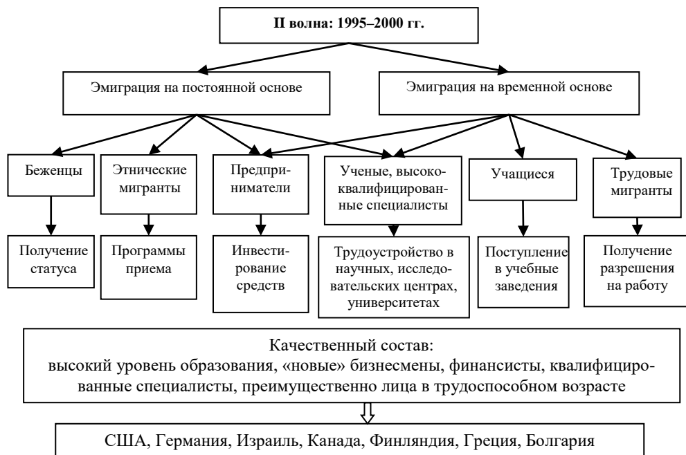
Рис. 2. Вторая волна эмиграции из современной России

ступенька для дальнейшей эмиграции и интеграции в новое принимающее сообщество. Брачная миграция, чаще женская, получает организованные формы и активно развивается. Сохраняется, хотя и в меньших масштабах, и формат получения статуса беженца.